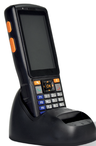
Symphone N2S с зарядной подставкой.