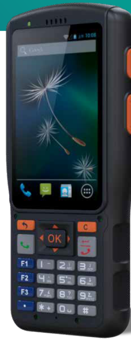
Symphone N2S Мобильный компьютер на ОС Android