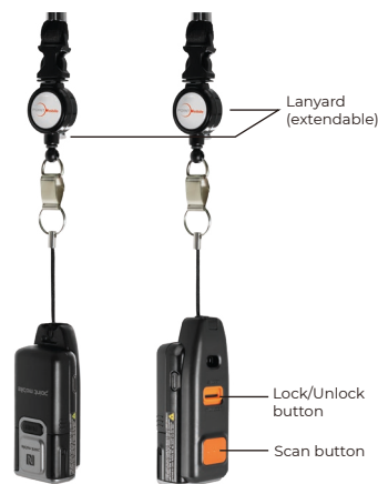
Переходник USB-C (можно использовать с ремешком)